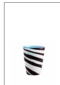
Mares Tumbler Clown Fish