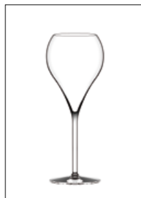
Balloon Magnum Flûte