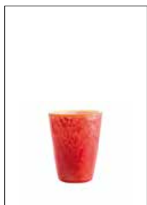
Mares Tumbler Star Fish