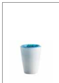
Mares Tumbler Angel Fish