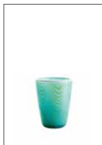
Mares Tumbler Jelly Fish