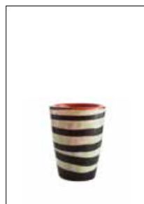
Mares Tumbler Tiger Fish