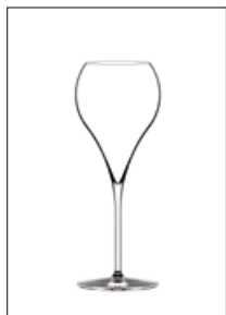
Grand Balloon Flûte