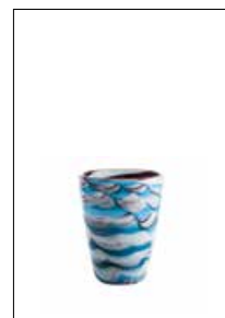
Mares Tumbler Napoleon Fish